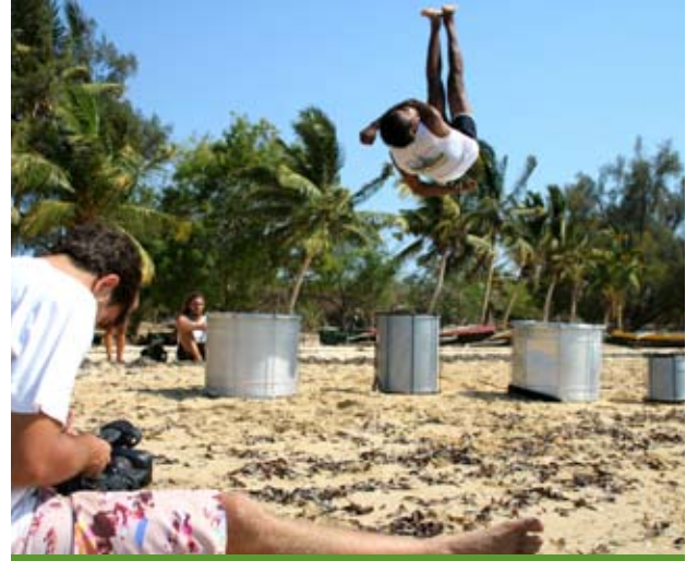
Rodaje del primer videoclip de Bloco Malagasy . Tulear 2010.

En pocos días publicaremos el primer videoclip del grupo en la web de la Fundación Agua de Coco.